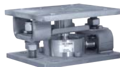
Kit de montage Silokit-R - Silokit-R mounting kit