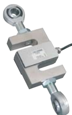
Rotules - Rod end ball joints